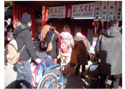
初詣 はつもつ 用 よう のお賽銭 さいせん の塀 へい 、高 たか いね、届 とど くかな？ さあ、おみくしよっと！