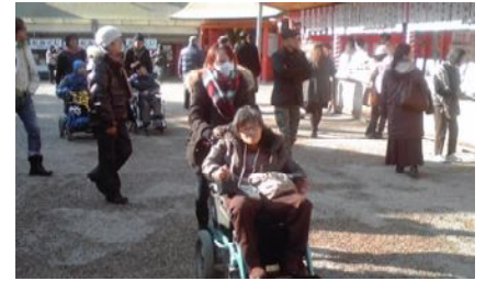
砂利 じゃり だね。車 くるま いすでは少し すこ 進 すす みにくいかな。