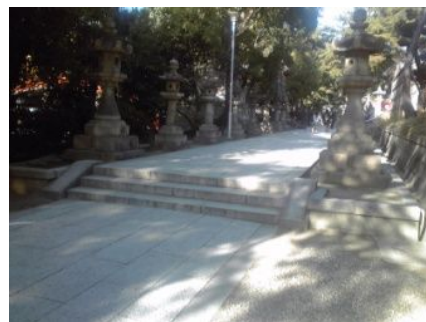
階段 かいだん や段差 だんさ のあるところもいくつかあるね