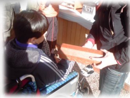
何 なに がでるかな♪