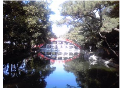
池 いけ にも映 うつ ってなんかきれいだね。