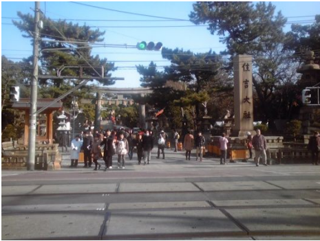
ちんちん電車 でんしゃ の線路 せんろ にご注意 ちゅうい ！