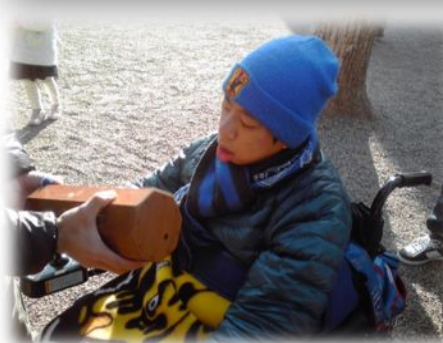
何 なに がでるかな♪