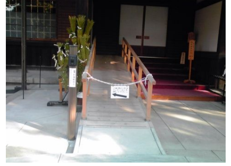
スロープがついているところもあるよ