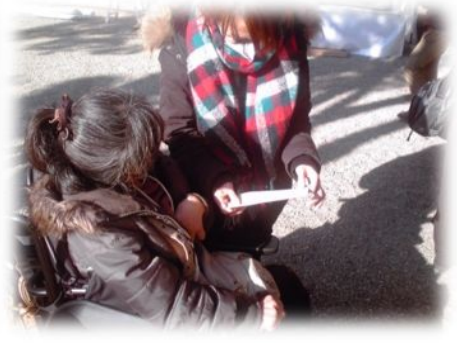
「大吉 たいきち だ〜！」