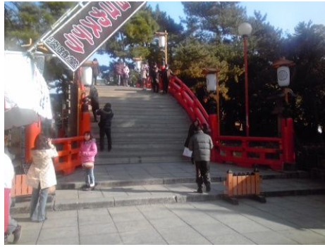
太鼓橋 たいこばし ！もし、車 くるま いすで渡るなら命 いのち がけだね。