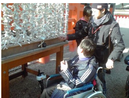
車 くるま いすでも結 むす べるかな…。