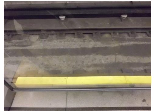
せんいちまえせん すきまざい きいろ 千日前線の隙間材(黄色)です

●通常は車両とホームの隙間は5cm～7cmになっていますが、ホームをスロープ状にかさ上げして、黄色の隙間材をホーム側の乗降口の先端に設置することで隙間を埋めています。(長堀鶴見緑地線は2cm、千日前線は3cm、御堂筋線の天王寺駅と心斎橋駅は3cmの隙間になります。)素材は硬質ゴムで出来ていて、くし状のゴムになっているので万が一、列車がホームに当たっても走行上、安全。その他の御堂筋線の駅に関しては6～8cm、今里筋線は6～8cmの隙間がそれぞれあります。今里筋線は隙間が少ない設計にされて