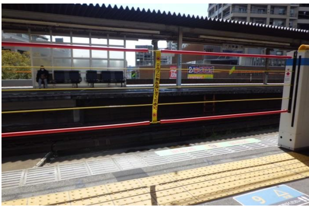
ろっこうみちえき さく JR六甲道駅のロープ柵

ぜんかい ろっこうみちえきしょうこうしき さく けんしょう 前回のJR六甲道駅昇降式ロープ柵の検証では、ロープとロープとの幅が広いということと、1番下のロープから地面までの幅も広いので視覚障害者が使っている白杖がホームの外に出たまま危ないこと、子どももロープの間から落ちるかもしれないので危ないと思いました。今回は京都市営地下鉄烏丸線の可動式ホーム柵と東西線のフルスクリーン式ホーム柵の検証へ行ってきました。