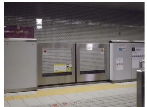
せんいちまえせん かどうしき さく 千日前線の可動式ホーム柵

きょうとしえいちかてつからすまおいけえき かどうしき さく からすません 京都市営地下鉄烏丸御池駅には可動式ホーム柵（烏丸線）とフルスク リーン式ホーム柵（東西線）が設置されていましたが、両駅ともホームと でんしゃ あいだ だんさ すきま くるま でんしゃ じょうこう としき りょう 電車 の間に段差と隙間があって、車いすで電車に乗降する時は、利用 する人によっては駅員にスロープを用意してもらい必要があります。 今度は、大阪市営地下鉄の可動式ホーム柵の検証に行きました。