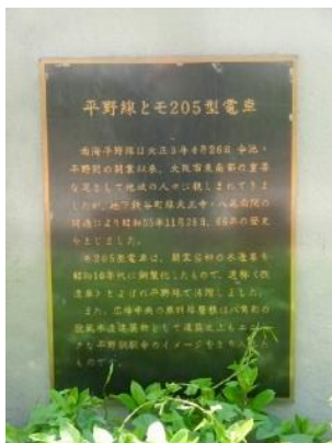
平野線についての解説