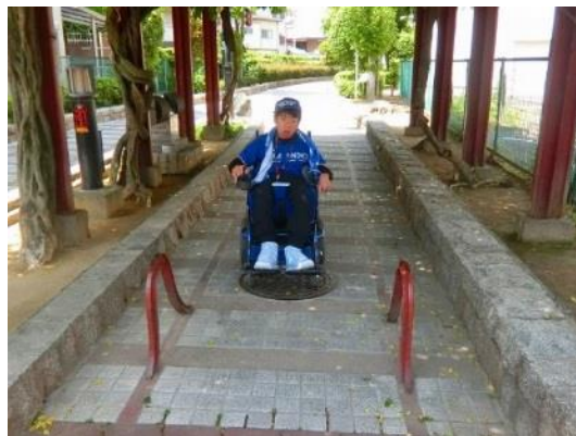
車両止めがあるね。