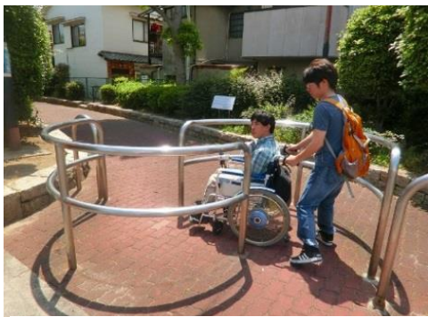
大きな車イスだと入りにくいね

ウィキペディアより～南海平野線は、大阪市西成区の今池停留場から同市の平野区の平野停留場までを結んでいた南海電気鉄道の軌道路線。開業以来、大阪市中心部と同市南東部を結ぶ交通手段として重要な役割を担ってきたが、1980年（昭和55年）11月27日に阿倍野 - 西平野間の路線のほぼ真下に沿って大阪市営地下鉄谷町線天王寺 - 八尾南間の路線が延伸開業したため、それまで担ってきた役割を同線に譲るかたちで、同日限りで廃止され、66年の歴史に幕を閉じた。