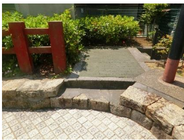
小さな出入り口は段差だね。