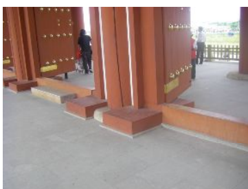
↑でも朱雀門の上からは外側には渡れないし、階段しかないのでお下りられないよ。