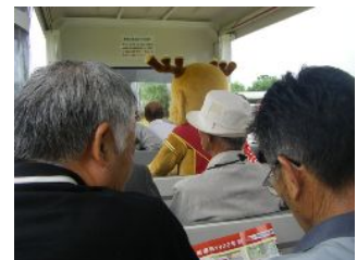
Are you せんと君?