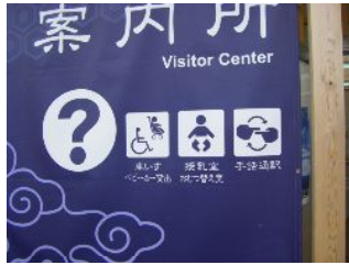
↑エントランス広場の案内所には車イスの貸し出しのほか、手話通訳という表示もありました