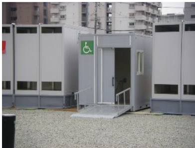
↑車イス用トイレがありましたよ。