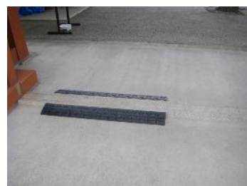
←朱雀門の外側には門の下から廻れます。敷居の部分に小さなゴムのスロープがついていたよ。