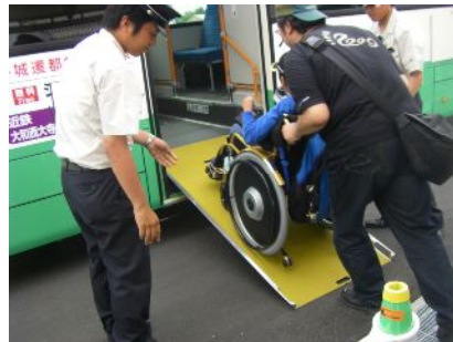
↑ノンステップバスでスロープがです。でも6月7日は2台乗れたのに14日には1台しかだめと言われました…。なので徒歩で向かったけど、道案内の人もあるし15分ほどで行けるよ。