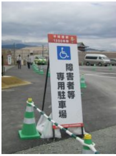
障害者用「駐車」スペースがあるよ。