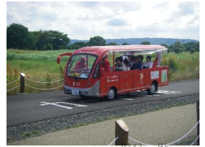
↑ハートフルカート(無料)が走っているよ。乗車条件はトラムと同じだけど、車椅子は折り畳まないと乗れないよ。