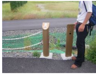
↑ただの杭に見えるけど、ここから「この先に階段があります」との音声案内が流れてたよ。