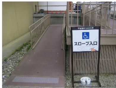
↑内側からは朱雀門に上がるスロープがあったよ。