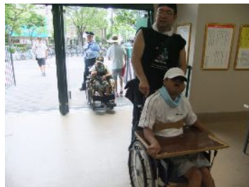
こうしえん い ぐち 甲子園の入り口はフラットです。