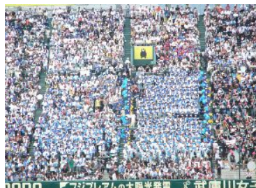
くらしきしょうぎようこうこうこうしえんだん 倉敷商業高校応援団