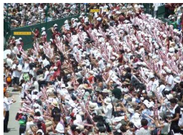
わ せだ じつぎようこうこうこうしえんだん 早稲田実業高校応援団