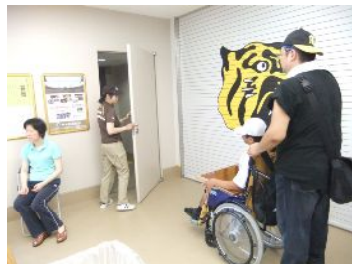
かかりいん はい とびら む 係員 しか入れない 扉 の向こうに、