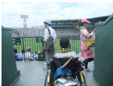
とびら で、こうしえん こうない 扉 を出て、甲子園構内からスロープを上ると・・・