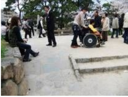
スロープありました！