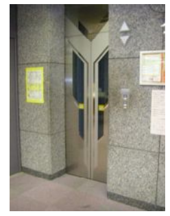
エレベーターもあるよ