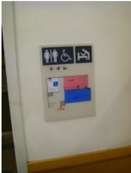
触知地図があったよ