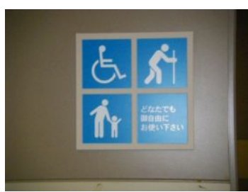
「どなたでも御自由にお使い下さい」と書いていますよ