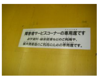
↑「障害者 サービスコーナーの専用席です。点字資料・録音図書などのご利用や、拡大読書器のご利用のための専用席です。」と書いています