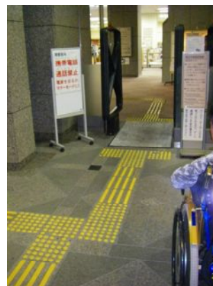
入口はフラットで、点字ブロックもあるよ。