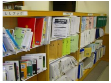
↑「LLブック」等が並んでいます。