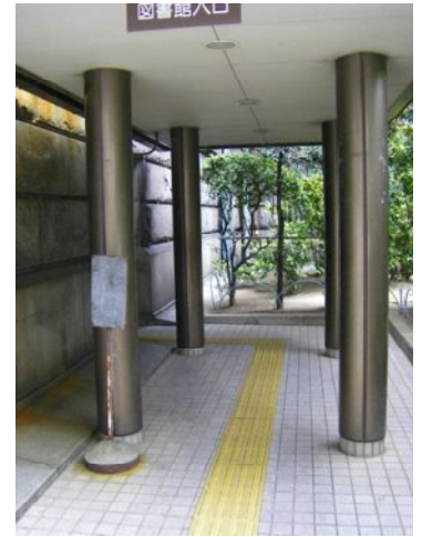
点字ブロックがあったよ

ここでは初めの受付のところで、大きな荷物は預けなきゃいけないだよ、館内撮影禁止ってことで写真は無いんだけど、1階に車椅子トイレはあったよ！2階以上には一般の人は階段を利用するんだけど、車椅子の場合は係員の人の案内で、エレベーターであがれたよ。建物もそうだけど、なんか敵かな雰囲気やったよね。