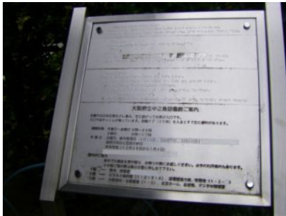
玄関までに点字案内板があったよ