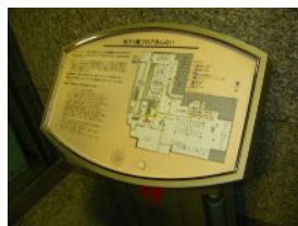
音声案内付き触知地図があるよ