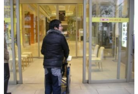
(北館出入口)。こちらは自動ドアだし、車いすで行きやすいね。(。)

「大トリックアート展」 2011年12月21日～1月25日に大丸心齋橋店イベントホール(北館14階)で開催。