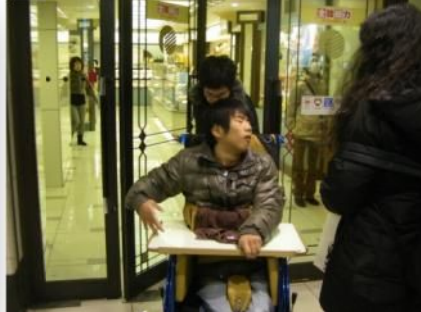
(本館出入口) 扉が手動なので、誰かに開けてもらわないと無理やね(´_`)