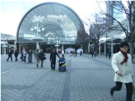
インテックス大阪はとにかくでかい!

ウィキペディアより～大阪国際見本市会場は、大阪市住之江区にある国際展示場。1985年に開業。インテックス大阪という愛称が付けられている。「インテックスプラザ」という名称の広場の周囲に1号館から6号館まで「コ」の字の形に6つの展示館が配置されている。