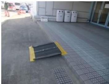
段差に簡易スロープ設置してたよ