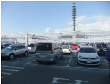
車いす利用者駐車スペースあるよ。