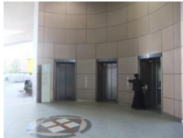
エレベーターもあるよ