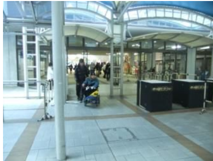
全体の出入り口もフラットで幅も広く、車椅子でも問題ないよ