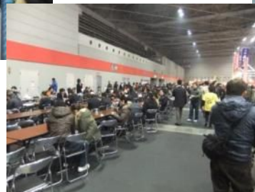
←食事スペースには長テーブルとパイプイスが並んでたよ。イスは移動できるので、車椅子でも大丈夫！

↑ぼくは、家族にお土産で薩摩揚げ！ 平日に行ったのに超満腹帝国は大盛況！ おなじみの全国B級グルメが食べられるよ！