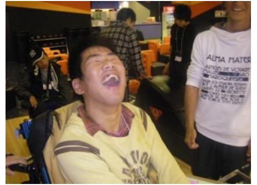
やったー! ストライクだー!