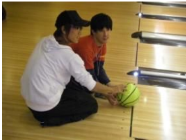
ほくも ころ 転がしてやるよ。