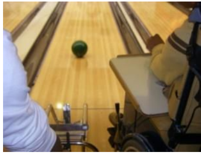
さあ、 い 行けー!