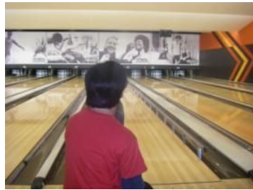
おっ、いい かん 感じ!