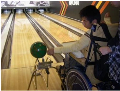
さあ、お お 押しして、 ころ 転がすよ!