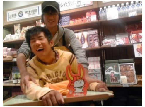
↑おっ、ひこにゃんがあったよ

ご当地市場、階段だけじゃ、困った困ったこまどり姉妹！。リニューアルしたのなら、やっぱりエレベーターがほしかったじゃありませんか！