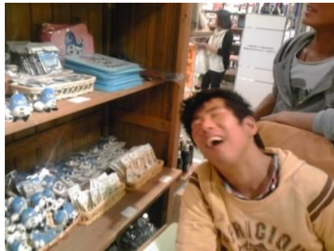
←でも、各ブースの通路はギリギリかなあ、