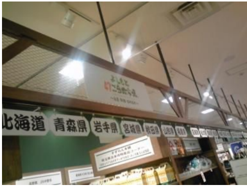
全国の名産がずらり！