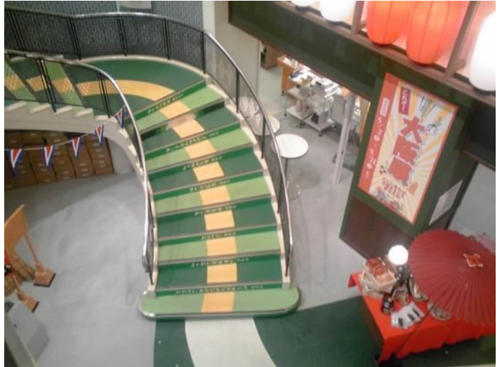
この下?、え、エレベーターがないの?、階段だけ?!