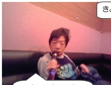
♪ズン、ズン、ズン、ズンドコ ♪