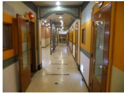
通路は車いす通れるね