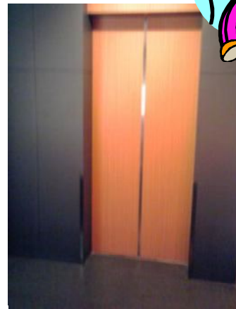
エレベーターもあるよ