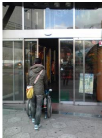
ビル入口は自動ドアでフラットだね じどう