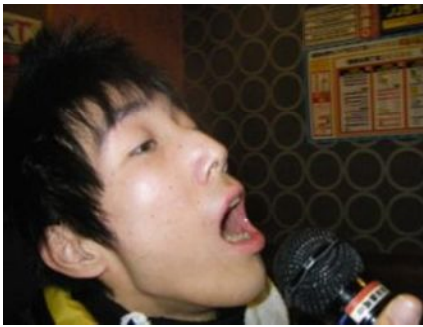
ぼくはジャーニースー筋! ひとすじ