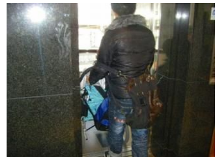
ビルの入口は自動ドアでフラットだね