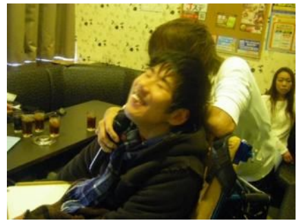
僕は・・・誰やろ? ぼく