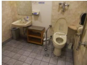
車いすトイレもあるね