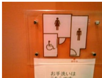
車いすトイレもあるね くるま