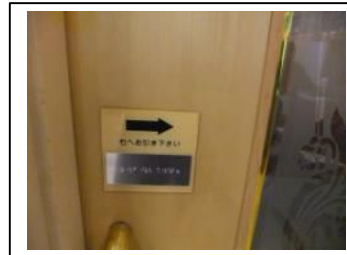
車いすでも入りやすく引き戸になってる部屋もあったよ！