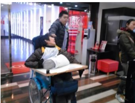
カラオケ入口もフラットだね。 いりぐち