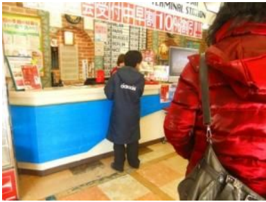
「2時間をお願いします。」