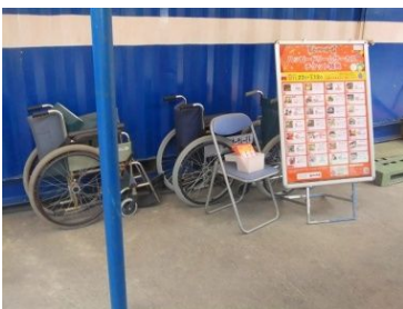
常備の車いすがあったよ