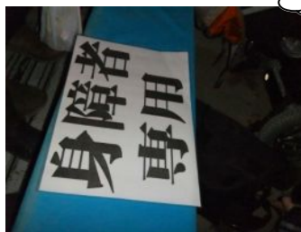
身障者スペースがあったよ。