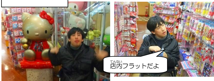
店内フラットだよ