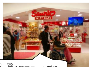
店内、広くてフラットだね