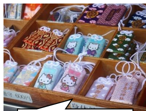
キティちゃんお守り