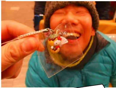
たこ焼き&はりせんをもったキティちゃん