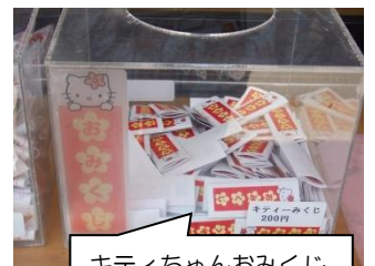
キティちゃんおみくじ