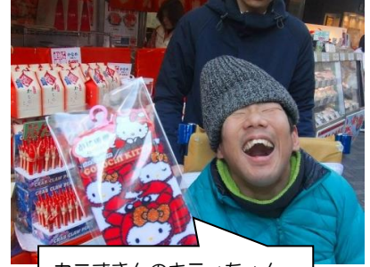
カニずきんのキティちゃん