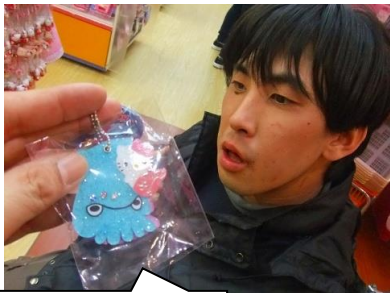
イカ&キティちゃん