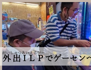
外出ILPでゲーセンへ♪