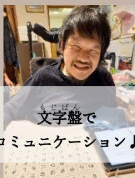
文字盤でコミュニケーション♪