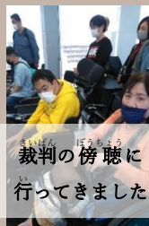
裁判の傍聴に行ってきました