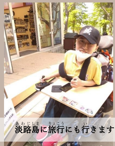
淡路島に旅行にも行きます♪